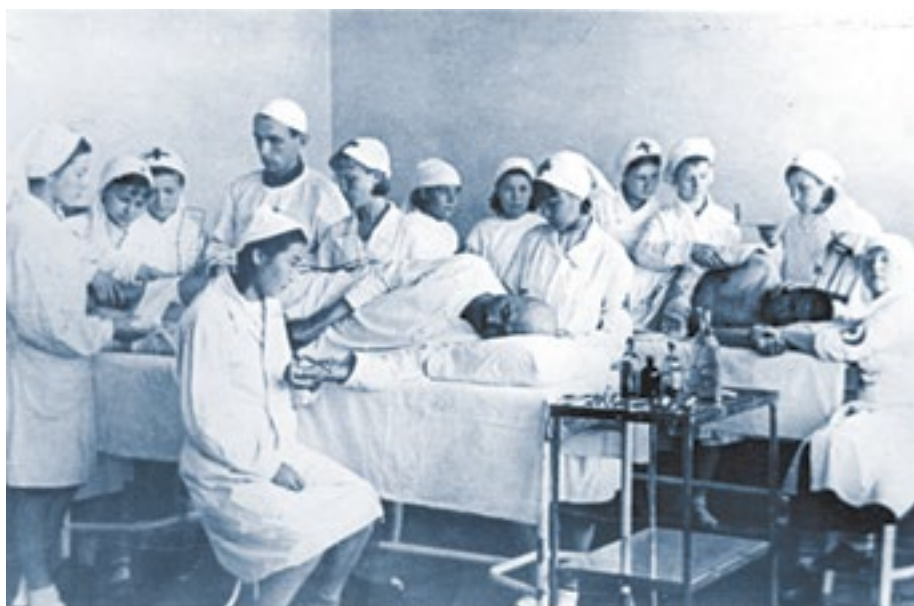
Госпиталь в годы ВОВ, перевязочная. Улан-Удэ, 1942 г.

«Победу мы выиграли ранеными» – это слова маршала Константина Рокоссовского. Он в полной мере отдавал дань не только фронтовикам и труженикам тыла, всеми силами поддерживавшим армию, но и тем, кто возвращал в строй бойцов, уже прошедших испытание войной. За годы ВОВ врачи вернули на фронт почти 18 млн (!) солдат и офицеров с боевым опытом.